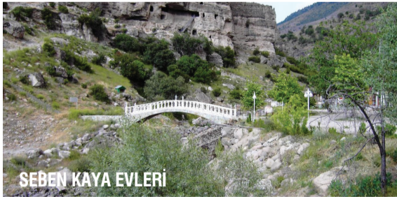
SEBEN KAYA EVLERİ

Bolu'nun Pamukkale'si olarak anılan 250 metre uzunluğundaki Akkayalar Travertenleri doğal yapısını koruyarak günümüze kadar ulaşmış.