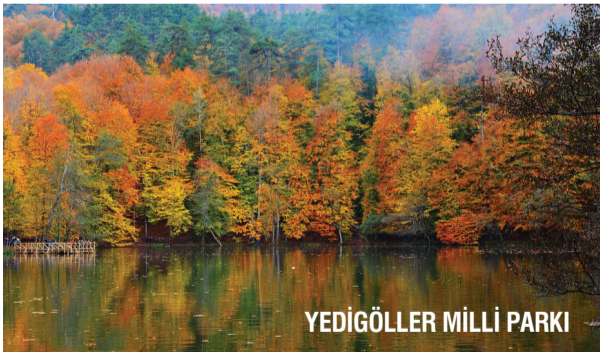
YEDİGÖLLER MİLLİ PARKI

Sazlıgöl, İncegöl, Küçükgöl, Deringöl, Büyükgöl, Kurugöl ve Seringöl'den oluşan Yedigöller; Bolu'nun gözde gezi yerlerinden. Muhteşem bir güzellğe sahip Yedigöller çevresinde trekking, piknik, gezi ve doğa fotoğrafçılığı yapmak mümkün.